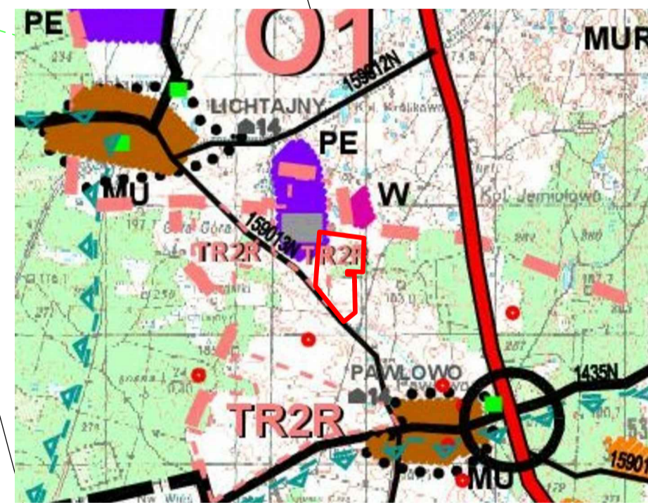
— GRANICA OBSZARU OBJĘTEGO PLANEM