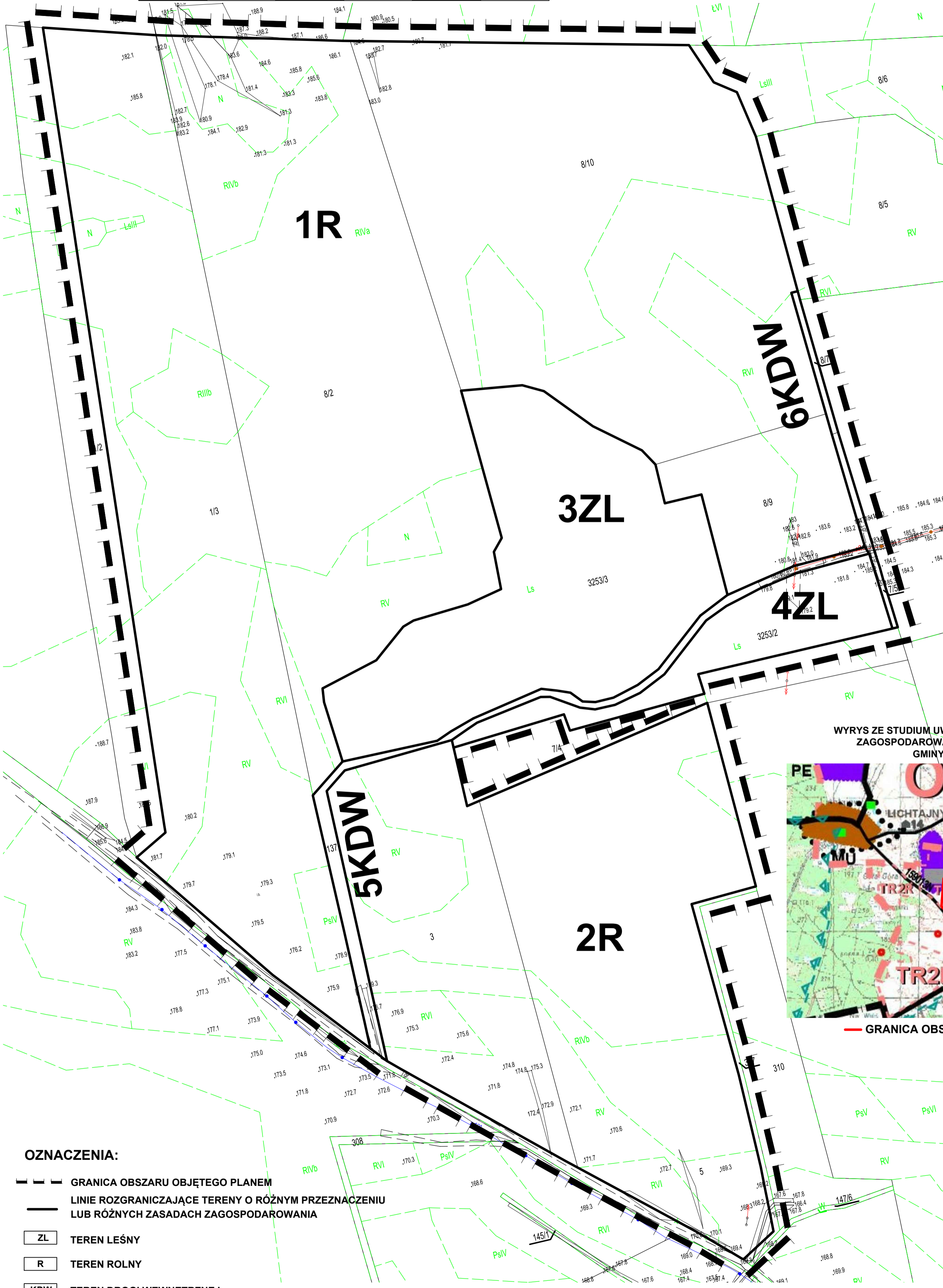
WYRYS ZE STUDIUM UWARUNKOWAŃ I KIERUNKÓW ZAGOSPODAROWANIA PRZESTRZENNEGO GMINY OLSZTYNEK